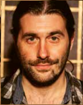
MORITZ MEYER Lichtdesign