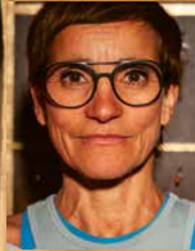
ANDREA PINKOWSKI Regie