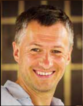
BENJAMIN KOLASS Produktion