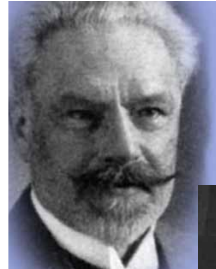
Carl Laufs (* 1858 – † 1900)

Die lexikalischen Definitionen von »normal« sind alle vollkommen und haarsträubend tautologisch: Um festzustellen, was normal