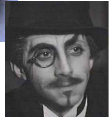
Wilhelm Jacoby (* 1855 – † 1925)